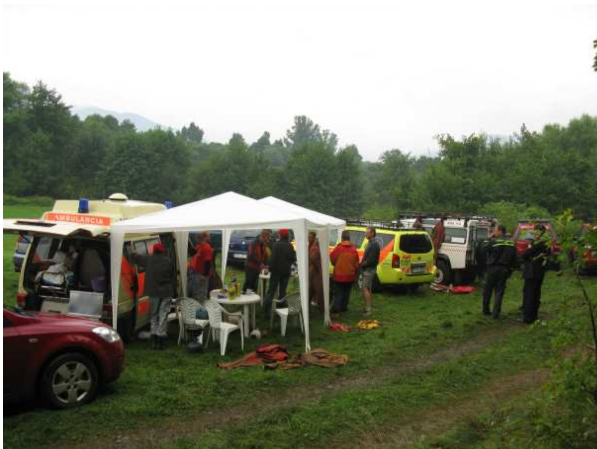
Čekání na povrchu