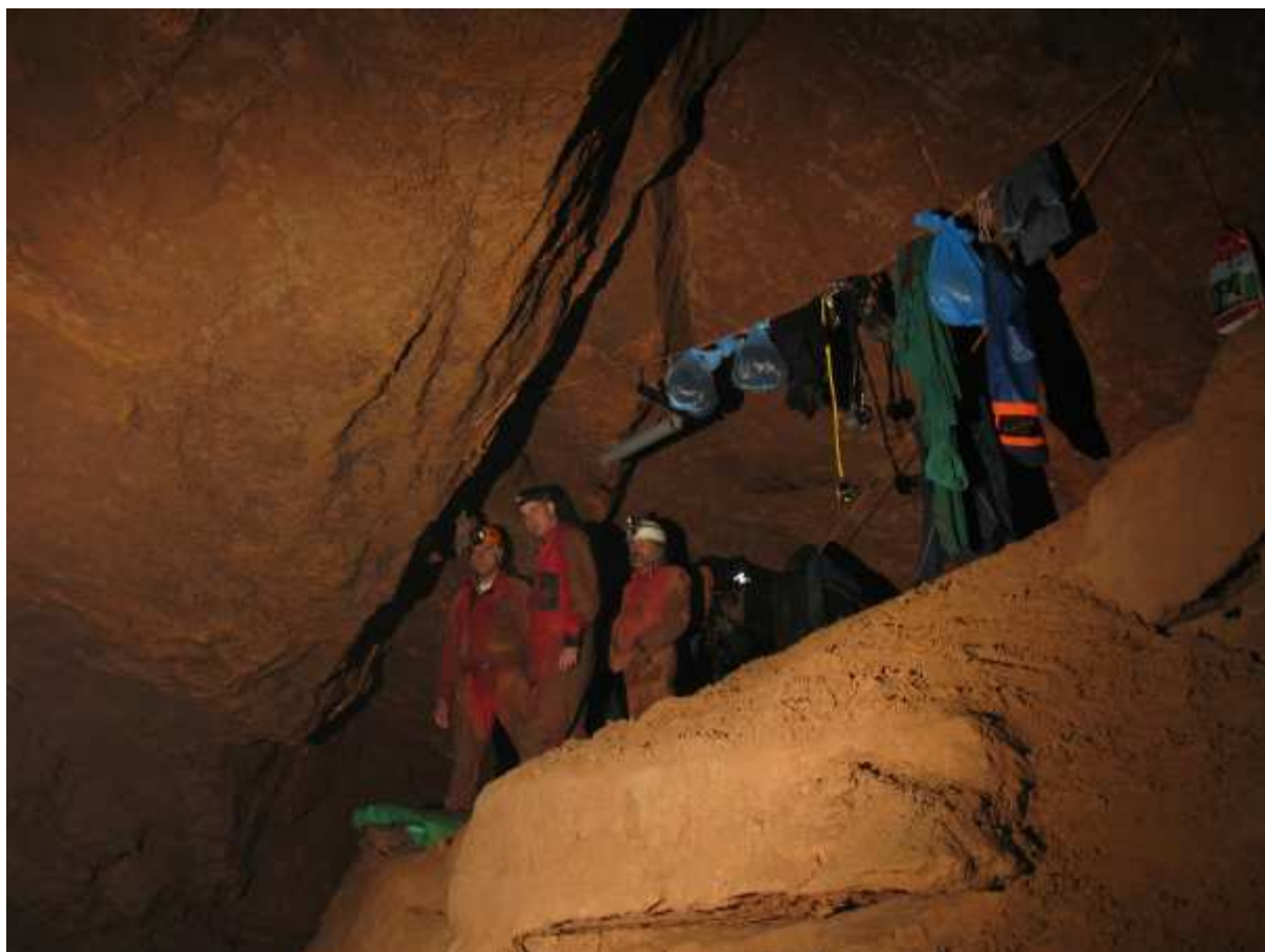
Tetínský dóm, místo převlékání potápěčů

Jeskyňě Hučiaca vyvěračka se nachází pod Plešiveckou planinou u vesnice Kunová Teplice. Na místě se nás ujímá Petr Kadlec z Tetínské skupiny a stručně nás seznamuje se situací. Vyjmenovává jaké centrály a kompresory je schopen zajistit, ale to v této chvíli není důležité. Na místě je též lékař z Horské služby, se kterým konzultuji hypotetický stav obou pohřešovaných, pokud jsou naživu v suché části za sifonem. Shodujeme se, že největším problémem bude pravděpodobně podchlazení a že je asi nebude možné okamžitě transportovat pod vodou. Na základě této informace dáváme dohromady vodotěsný barel s provizorní bivačovací výstrojí za sifon. Nutno podotknout, že jeho obsah dáváme dohromady ze svých osobních věcí. Veškeré zázemí na místě je totiž nulové! Není zde zajištěno ani osvětlení, ani technické vybavení a co je nejhorší, nejsou tu ani jeskyňáři, co by nám pomohli odnést věci k sifonu. Jak prozřetelné bylo s sebou vzít i ostatní účastníky naší expedice (další dvě auta jsou tou dobou již na cestě a z Prahy a Brna vyráží další tým potápěčů).